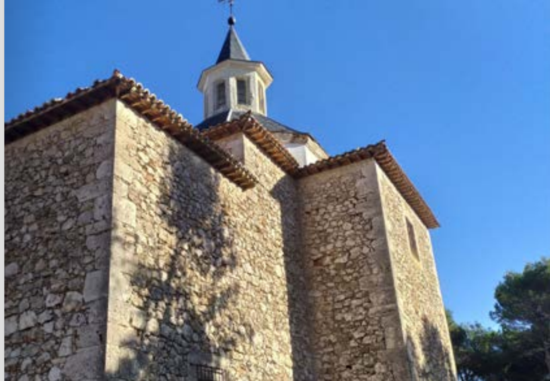
Iglesia de Santo Domingo de Silos. Pozuelo del Rey.

Esta impresionante construcción se divisa a kilómetros de distancia y su privilegiada situación sobre un risco que domina el pueblo hace que, dependiendo del lugar desde donde la observemos, pensemos que está levitando sobre los campos. Con una mezcla de los estilos gótico, renacentista y barroco, su origen se debe a un castillo-hospital de la Orden Hospitalaria del siglo XII. Para su construcción, se usaron los restos del castillo hispanoárabe que se levantaba en este lugar. De hecho, la iglesia se halla rodeada por los restos de la muralla de la desaparecida fortaleza.