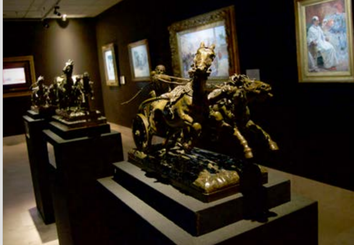
Museo Ulpiano Checa. Colmenar de Oreja.

Ulpiano Checa llegó a ser la firma más cotizada del arte europeo entre los años 1890 y 1910. Su obra está representada en el Museo del Prado, en el Thyssen y en muchas e importantes pinacotecas y colecciones del mundo entero. Obtuvo distinciones como la Legión de Honor Francesa o la Medalla de Oro en la Exposición Universal de París de 1900. Fue el primer español que expuso en la prestigiosa galería de Georges Petit de París, mucho antes de que lo consiguiera Joaquín Sorolla. Y, sin embargo, hoy es un autor inexplicablemente olvidado. Ulpiano Checa, nació en Colmenar de Oreja en 1860 y este Museo reúne algunas de sus obras de temáticas históricas y románticas más importantes.