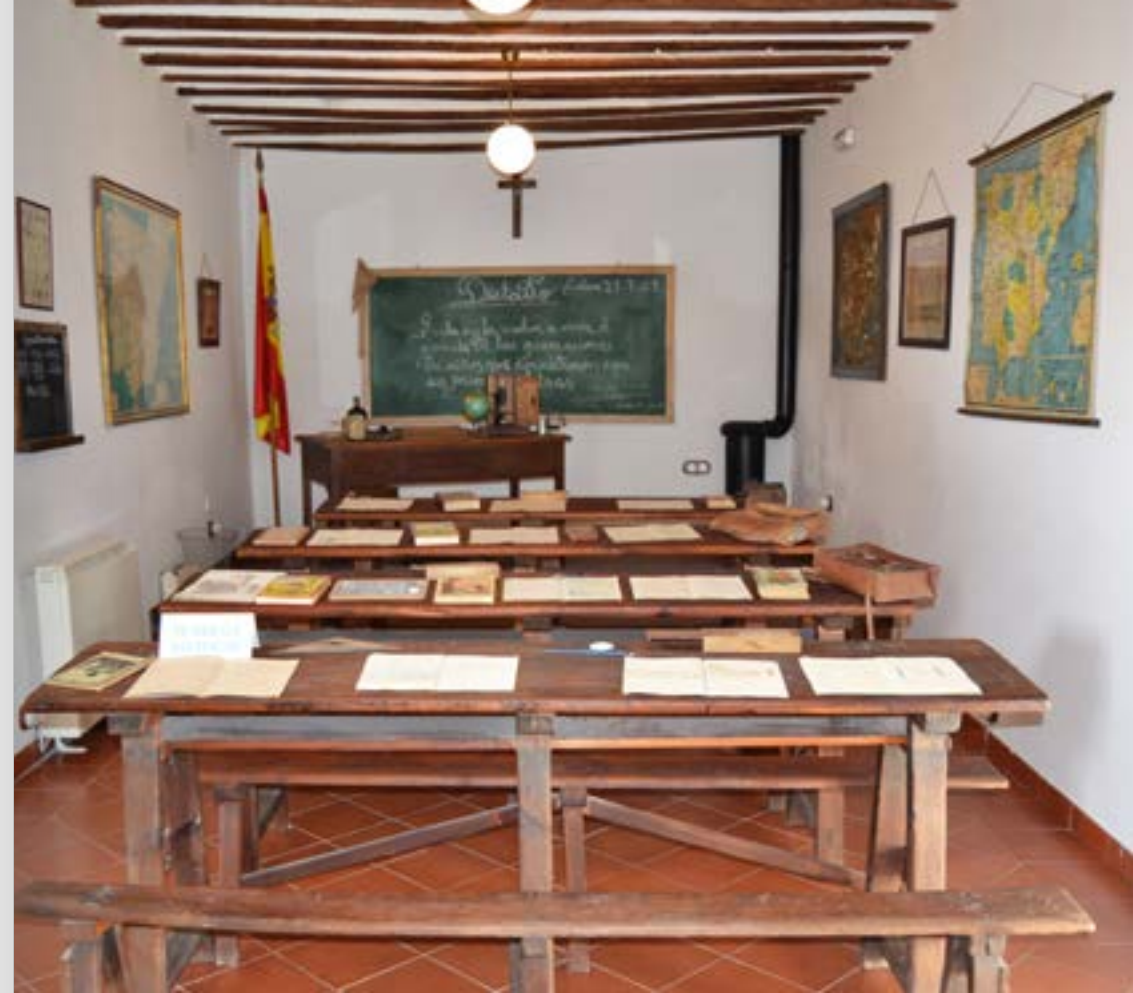
Museo Casa y Escuela Rural. Tielmes

En Tielmes se cuida y se protegen el ritmo y estilo de vida del pasado. Tienen una Casa Museo y Escuela Rural que nace con objeto de recuperar y mostrar la vida típica diaria de sus gentes. Otra muestra de la vida popular en Tielmes, son las casas-cueva tan frecuentes en el valle del Tajuña, excavadas en el Cerro de las Perdices, aprovechando la composición calcárea del terreno. Un tipo de viviendas que podemos conocer en el Museo casa-cueva de la localidad.