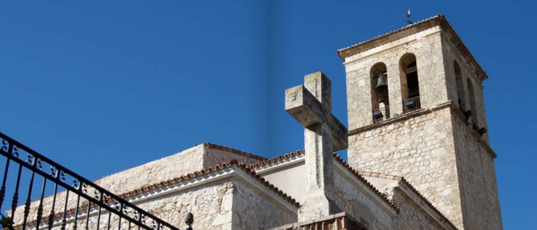
Iglesia de la Asunción. Carabaña.