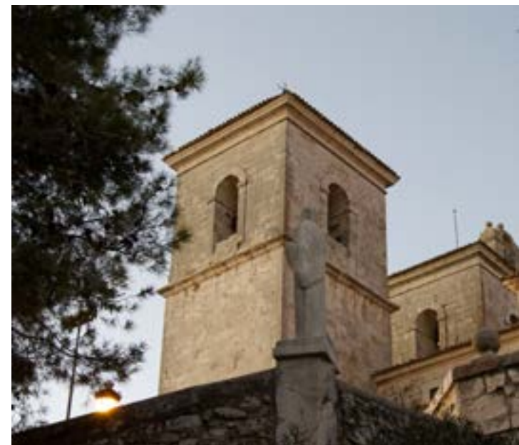
Iglesia de Nuestra Señora del Castillo. Campo Real.