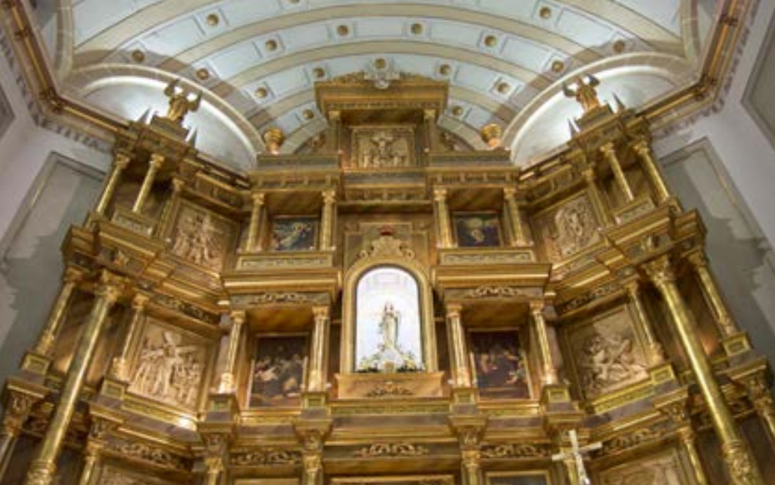
Iglesia de Nuestra Señora de la Concepción. Morata de Tajuña.